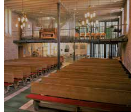
Blick vom Altarraum in das Kirchenschiff unserer Gethsemanekirche.

Gottesdienst feiern wir meistens im Kirchenschiff - was für ein schönes Bild für das, was Kirche sein soll! Ein Schiff darf nicht dauerhaft im sicheren Hafen festliegen. Es erfüllt seinen Zweck nur, wenn es über das Meer fährt, Menschen oder Fracht befördert und neue Horizonte erschließt. Das ist angesichts von schweren Stürmen und heftigem Seegang nicht immer ungefährlich. Es erfordert vielmehr Mut.